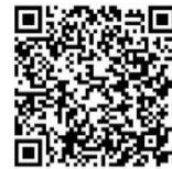
Reservierung von Räumlichkeiten für unsere Gruppen

Bürozeiten: Dienstag u. Mittwoch 09:00 - 12:00 Uhr Donnerstag 14:30 - 18:30 Uhr