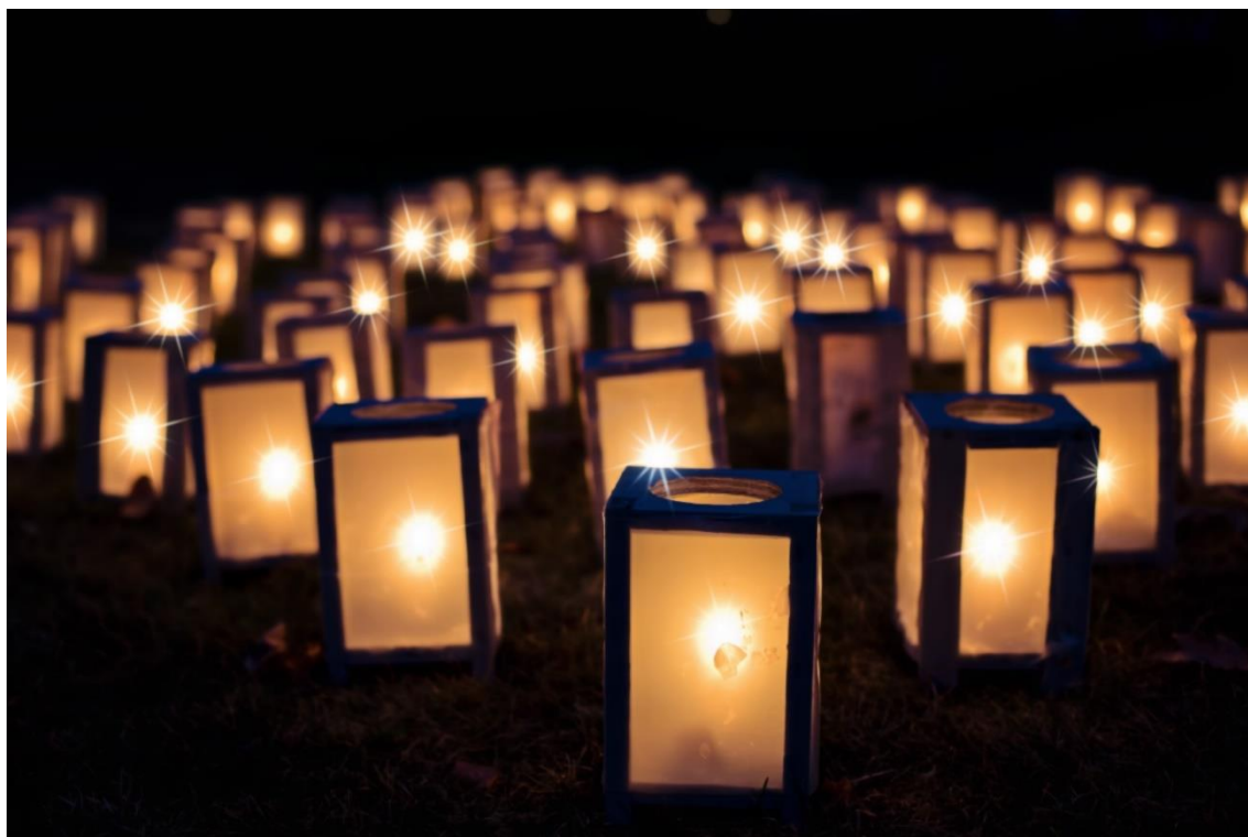
11.09.2019 Hoffnung Laterne Licht Lichtermesse Martin Martinszug Nikolaus Sankt Martin St. Martin

Freitag, 27.11. um 18:00 Uhr im Bürgerbegegnungszentrum Wöhlehof in Spelle. Anmeldungen bis zum 20.11. per Mail an Gleichstellungsbeauftragte@spelle.de